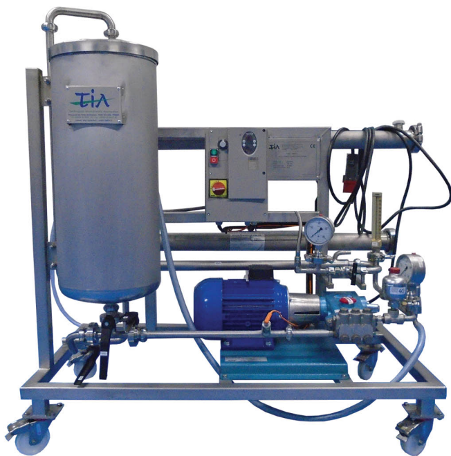
Vue d'ensemble avant du séparateur membranaire TIA